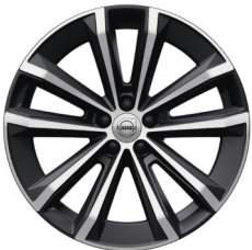
19" 5-Dubbel Spaaks Matt Graphite / Diamond Cut 1166