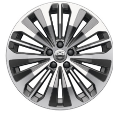
18" 5-Triple Spaaks Graphite / Diamond Cut 1099