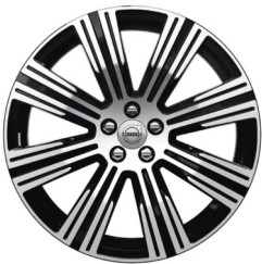
20" 8-Multi Spaaks Black / Diamond Cut 1139