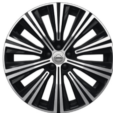
19" 10-Spaaks Black / Diamond Cut 1142