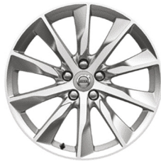
18" 10-Spaaks Turbine Silver Bright / Top Cut 154