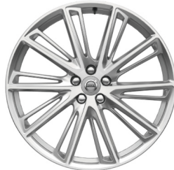
21" 10-Open Spaaks Tinted Silver 800131