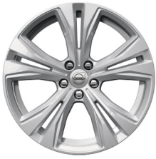
18" 5-Dubbel Spaaks Silver Momentum Business