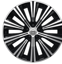
18" 10-Spaaks Black / Diamond Cut Inscription